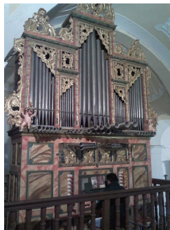
Capillas Audición del Órgano