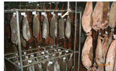
Villarramiel Fábrica de Cecinas