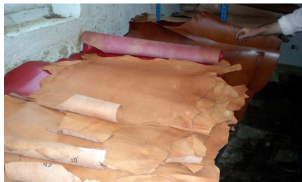
Villarramiel Fábrica de curtido de piel