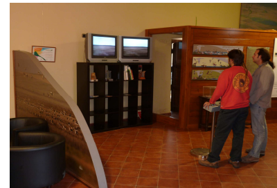
Boada de Campos Interpretación de la Laguna