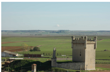
Belmonte de Campos Castillo

Ruta diseñada para la estimulación de los sentidos, donde podrá descubrir esta zona sorprendente de Tierra de Campos.