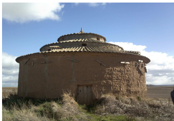
Castil de Vela Palomar